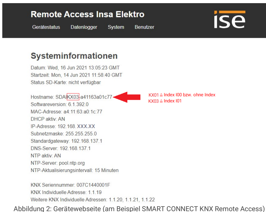
Abbildung 2: Gerätewebseite (am Beispiel SMART CONNECT KNX Remote Access)